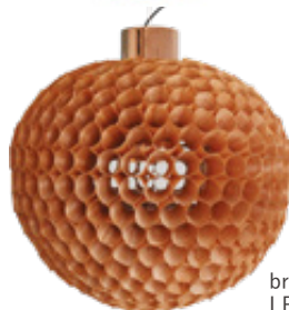
brown wood LP3063BD