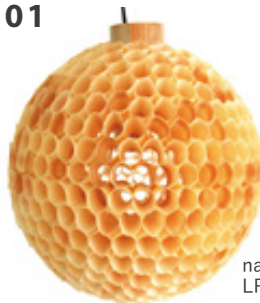
natural wood LP3063ND