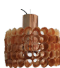
brown wood LP3064BD