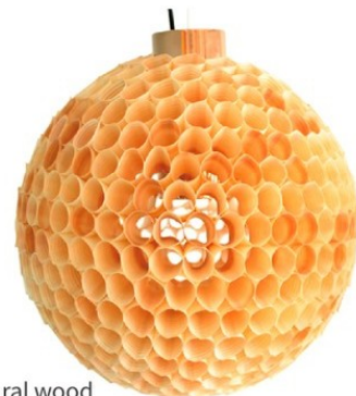
natural wood LP3063ND

カラー natural wood, brown wood 材質 スチール, 天然木(杉材) サイズ 約Φ350 高さ調節：(全高) min600~max1450 光源 E-17 40W 白熱レフ球 重量 約 1.0kg JAN natural wood : 4580157050746 brown wood : 4580157050753