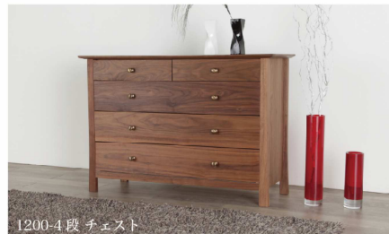
1200-4 段 チェスト

わずかに跳ね上がったような天板と、末広りの脚が、スタイリッシュなフォルムを生む"ソレイユ"シリーズ。ウォールナットの素材感と真鍮のツمامミが上質な存在感を作り上げています。