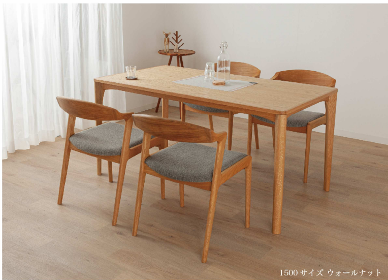
1500サイズ ウォールナット