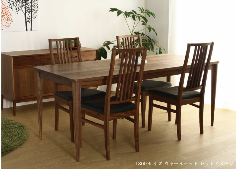
1800 サイズ ウォールナット セットイメージ