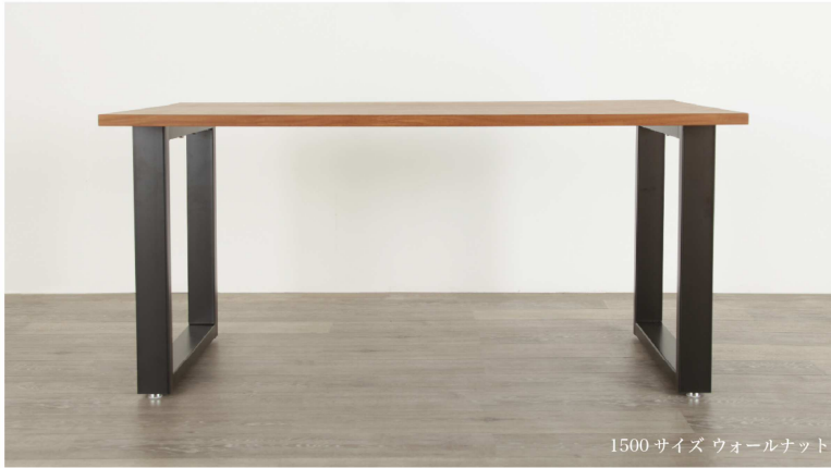
1500サイズ ウォールナット