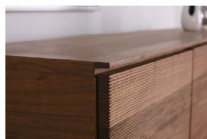
前板の繊細な表情を活かした 天板の面材加工

独特の面状とステンレスの脚部のコントラストから生まれる、 大人のリビングにふさわしい円熟味と遊び心を感じさせてくれます。