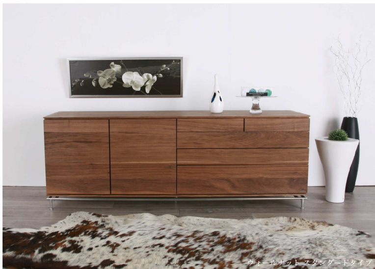
ウォールナットスタンダードタイプ