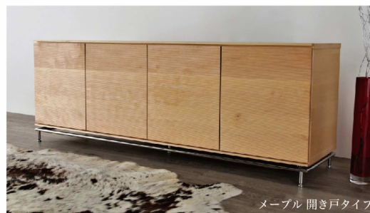
メイプル開き戸タイプ

※スタンダードタイプは開き戸と引出しの組み合わせとなります。 ※素材の特性上、オーク材での製作はできません。