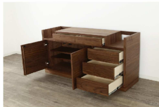
プッシュオープン扉と引出し。