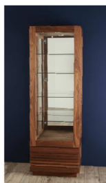
"Jaggy" Curio Case "ジャギー" キュリオケース (P.72 掲載)

引出しや扉の追加、足などのデザイン変更など 標準の仕様を元にした変更が可能です。