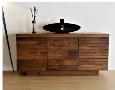
"Crater" Living Board "クレーター" リビングボード (P.31 掲載)

テレビボードのデザインを元にしたキャビネットやデスクの製作など、 標準のデザインを元にした仕様変更が可能です。