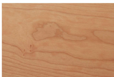
ブラックチェリー