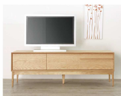
"Ref line" TV Board "レフライン" TV ボード 1500 オーク (P.23 掲載)

お部屋のサイズ、イメージに合わせ、 幅・高さ・奥行・素材の変更が可能です。 また、仕上げも基本のクリアオイルから着色や 撥水性の高いウレタン仕上げへの変更も承っております。