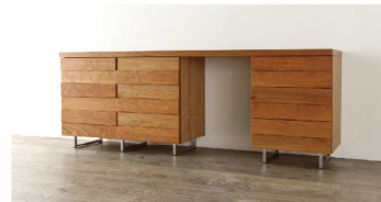
リビングボードを元に ステンレス脚を使用したデスクタイプへ変更しました。