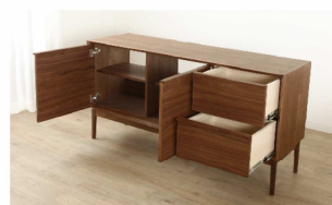
材料をウォールナットに。 収納高さを変更し、フラップ扉を開戸へ変更。