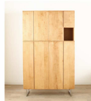
サクラ材の本体にステンレス脚を 使用した完全オリジナルの玄関収納。