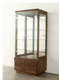
ガラス扉の枠を撤去し、ガラスのみの扉に。 下部引出しも開戸へ変更しました。