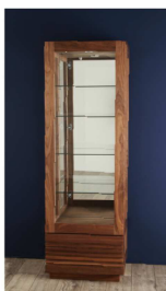
"Jaggy" Curio Case "ジャギー" キュリオケース (P.72 掲載)

引出しや扉の追加、足などのデザイン変更など 標準の仕様を元にした変更が可能です。