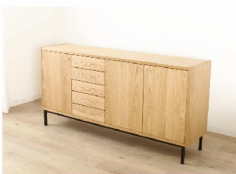
オーク材の本体に真鍮製の金具を使用し、 黒塗装のアイアン脚で 足元をすっきりさせたリビングボード。