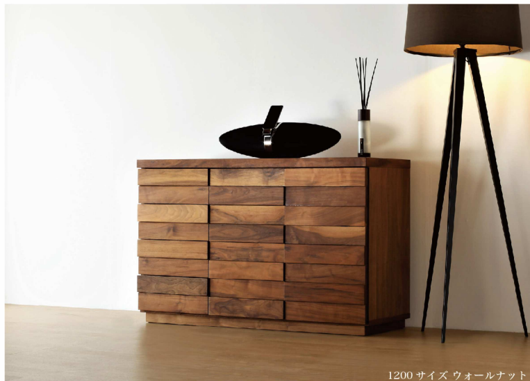
1200 サイズ ウォールナット