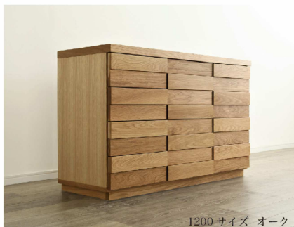
1200 サイズ オーク