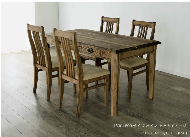
1500×800 サイズ パイン セットイメージ Clivia Dining Chair (P.50)