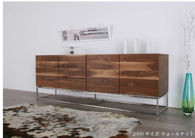
2000 サイズ ウォールナット