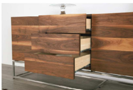
扉と前板の表情を活かす、 取手のないプッシュオープン仕様

扉・前板を前面に出し、側板・天板の小口を隠したシンプルなつくりのデザイン。 あえて白太の入った素材を使用することで、 ダイナミックな木の表情がリビングに確かな存在感を与えてくれます。 ステンレスの脚はHL仕上げで、木の質感をさらに引き立てます。