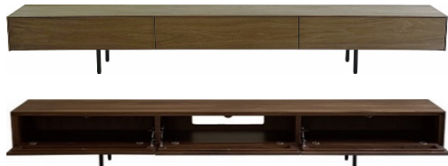
220TVボード（中央開口、左右コード抜き穴）